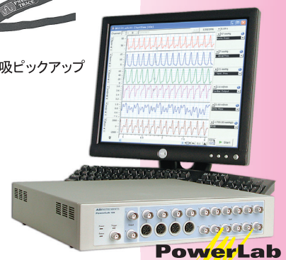
データ収録・解析のゴールドスタンダード

ML880P PowerLab16/30 ChartPro付き、バイオアンプ×3、GSRアンプ、EOGキット、オキシメータポッド、サーミスタポッド×2、鼻の呼気温測定プローブ、皮膚温測定プローブ、ピエゾ呼吸ピックアップ、ディスポーザブルECG電極(100)、ビデオカメラ、コンピュータ