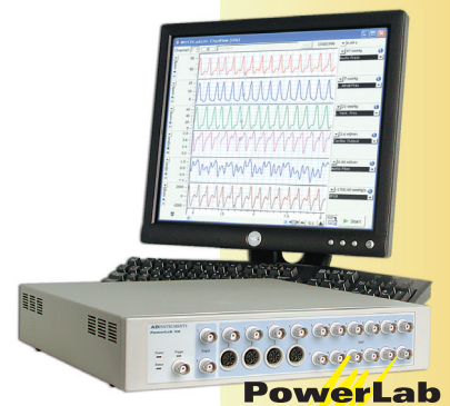
データ収録・解析のゴールドスタンダード

ML846 PowerLab4/26、電子天秤（アナログ出力オプション付）×4、代謝ケージ×4、コンピュータ（Windows）